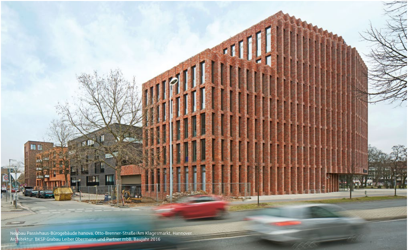
Neubau Passivhaus-Bürogebäude hanova, Otto-Brenner-Straße/Am Klagesmarkt, Hannover Architektur: BKSP Grabau Leiber Obermann und Partner mbB, Baujahr 2016