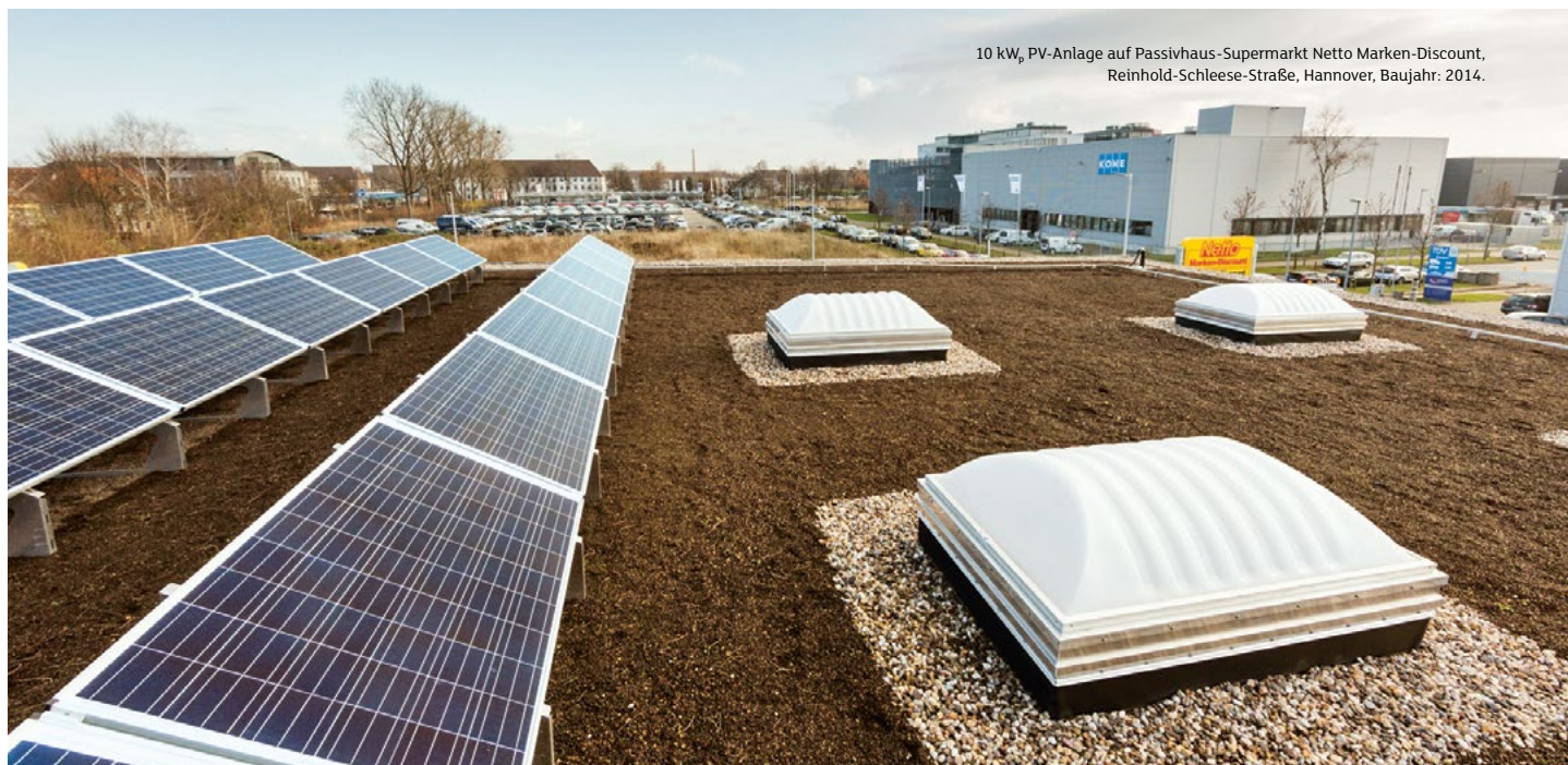
10 kW p PV-Anlage auf Passivhaus-Supermarkt Netto Marken-Discount, Reinhold-Schleese-Straße, Hannover, Baujahr: 2014.